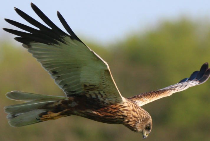
Bruine Kiekendief - man

En toen ineens, tussen de vele eenden en ganzen zagen we daar de Casarca, een kaneelkleurige exoot die zich steeds vaker in Nederland laat zien. We telden er opvallend veel in dit gebied.