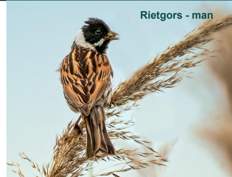
Rietgors - man

Eenmaal bij de auto was het tijd voor een pauze en wij trakteerden iedereen op een kop koffie met iets lekkers erbij.