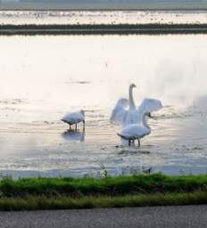
knobbelzwanen in ondergelopen bollenveld

Tijdens onze recente vogelexcursie hebben we het er al even over gehad: de onder water gezette bollenvelden tussen Sint Maarten en Den Helder. Deze natte akkers vormen in de zomermaanden een waar paradijs voor vogels.